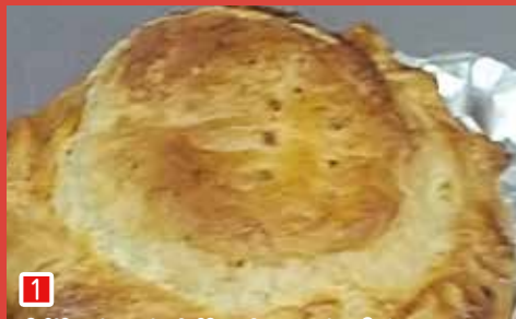
1 市川のトマトを使ったミートパイ マロニエ洋菓子店 (市川市若宮 3-23-11)

市川市内の各店が「市川とまと」を使ったメニューを開発しました。 趣向を凝らして考案した、バラエティ豊かな市川の味をお楽しみください。