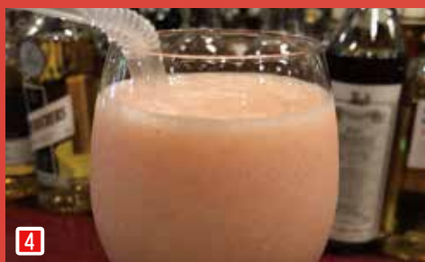
4 TEKONA - 手児奈 - BAR PEAT (ハービート) (市川市南八幡 3-4-8 HK アルファビル 2F)