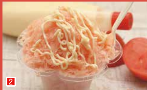
2 トマトのかき氷 魁ジェラート (市川市八幡 5-1-26)