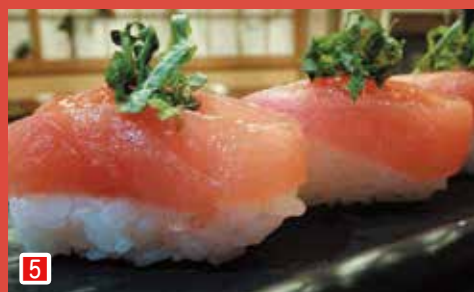
5 市川トマトの握り寿司 寿司バル 八幡 BASE (市川市南八幡 5-7-12 ルミエール 1F)