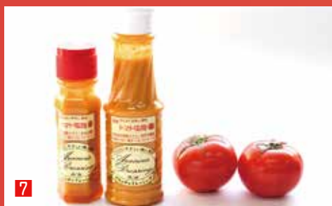
7 市川産のトマト塩麹ドレッシング アランチャドレッシング (市川市真間 2-14-14)