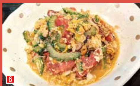
6 トマトとゴーヤの海鮮炒め 秋田料理と炙り まるみや (市川市南八幡 5-3-20)