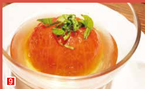
9 市川産トマトの冷製 ワインバー フェリア (市川市市川 1-12-11)