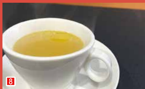
8 市川トマトのコンソメスープ 焼鳥ビストロふじ (市川市市川 1-17-10 大門通り 1F)