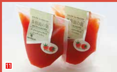
11 果樹園の朝 (トマト) 創作洋菓子モンペリエ (市川市市川南 1-5-17)