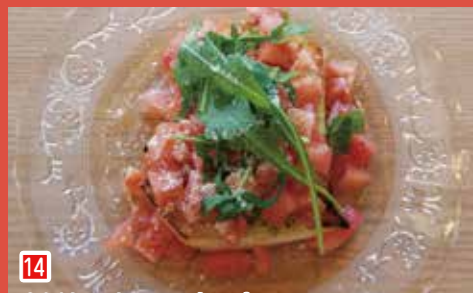
14 市川とまとのこぼれブルスケッタ ベジバル チパットリア (市川市行徳駅前 3-15-1)